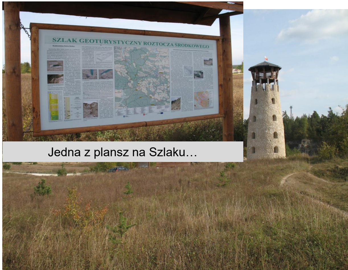
Jedna z plansz na Szlaku...