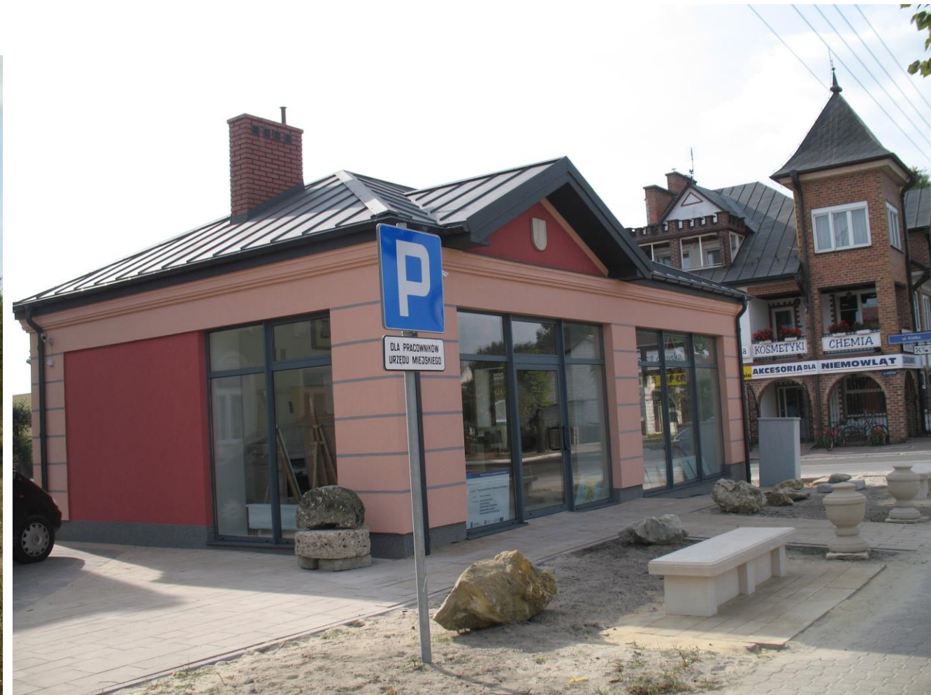
Pawilon geoturystyczny w Józefowie