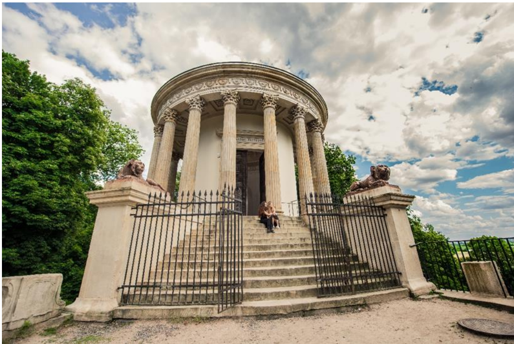
Świątynia Sybilli w Puławach

örökölte. Az ő kezdeményezésére, 1725-1728-ban a palotát a morvaországi Franciszek Antoni Mayer tervei alapján átépítették. A munkálatok befejezése után a palota Maria Zofia Sieniawska és August Czartoryski, a Pogoń Litewska címeres ruténiai vajda házassága révén a Czartoryski család tulajdonába került. 1812-ben örököseik, Adam Kazimierz és Czartoryski Izabella, született Fleming, lettek a rezidencia tulajdonosai. Az évek során a számos átépítés és a háborús károk után az eredeti berendezési tárgyak nem maradtak meg. Csak a lekerekített sarkú alkóvok, SOCIETAS SCIENTIARUM LUBLINENSIS latin feliratú kőkapu, valamint a reprezentatív terem kazettás mennyezete maradtak meg.