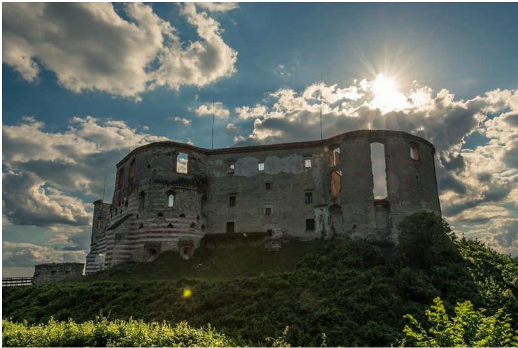
Janowiec nad Wisłą

JANOWIEC - a Visztula folyó partján fekvő falu, korábban város, 1325-ben Syrokomla néven említik. Egy magas sziklafalon állnak a Firlej család várának lenyűgöző romjai. Az első várat 1537 előtt építették itt, a Lewart címeres Piotr Firlej finanszírozásával. A reneszánsz stílusban Santi Gucci építész, majd a gamereni Tylman által átépített épület barokk formát kapott. Az 1656-os svéd invázió során lerombolták, és soha nem építették újjá. Fénykorában a kastély 98 szobával és 7 nagy teremmel, két udvarral, egy kápolnával és egy galériás palotával rendelkezett. 1803-ban elhagyták, és pusztulásnak indult. 1975-ig magántulajdonban volt. Jelenleg a Nadwiślańskie Muzeum székhelye.