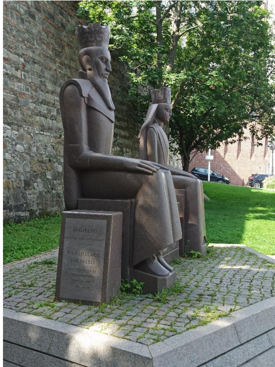
Hedvig és Jagelló, Budai vár - Fot. Sutarski Szabolcs