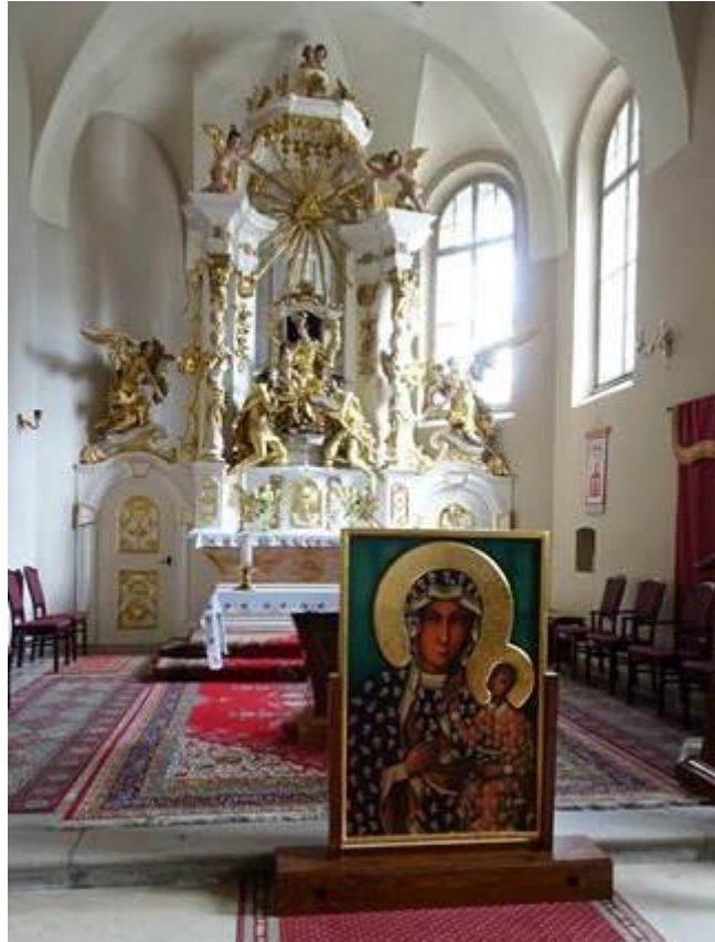
Miskolc, imakörút - Fot. Szabó Mónika