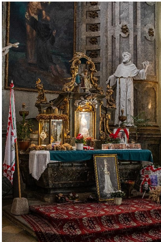
Eger, Minorita templom