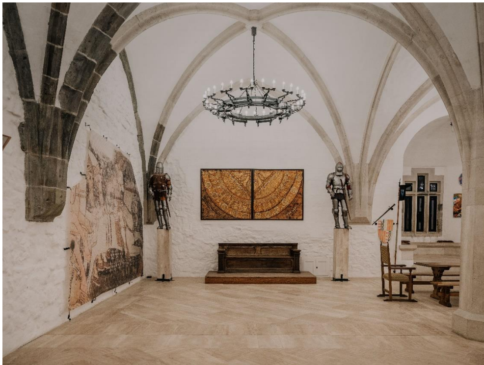
Diósgyőr, Szent Hedvig kápolnája