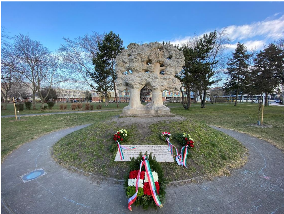
A két tölgy, Győr - Fot. Győr MJV Lengyel Nemzetiségi Önkormányzata

Győr belvárosában, a Bem tér központi részén, egy kis halom tetején két lombos koronájú tölgyfa álldogál egymás mellett, gyökereik összefonódnak, mintha egymásba kapaszkodnának. A 2006-ban felállított emlékmű alatt Stanislaw Worcell sorai állnak: „Magyarország és Lengyelország két öröklött tölgy, melyek külön törzset növesztettek, de gyökereik a föld alatt messze futnak, összekapcsolódnak és láthatatlanul egybefonódnak. Ezért egyiknek léte és erőteljessége a másik életének és egészségének feltétele.”