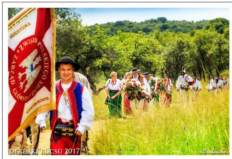
Derenki búcsú 2017

– lett példaképe. A bukás után az Oszmán Birodalomba menekül és politikai megfontolásból iszlám hitre tér. Bár maradványait 1929-ben hazaszállítják Lengyelországba, nem engedik a földbe temetni, így szarkofágját hat oszlop tetejére, a magasban helyezik el szülővárosában, Tarnów-ban. A hadvezér szobra Budapest II. kerületében a róla elnevezett téren áll, halála 100. évfordulója alkalmából pedig a Duna-part egy részét Bem-rakpart névre keresztelik. Létezett egykor egy lengyel település is hazánkban. Az Aggteleki Nemzeti Park területén fekvő, a török idők után elnéptelenedett Derenket az Esterházyak lengyel favágókkal és szénéégetőkkel telepítették be a XVIII. században. Az itt elzártnak élők egy belterjes közösséget alkottak, s így mindvégig megőrizték nyelvüket, szokásaikat. Az ősei földjét elhagyni nem akaró lakosságot 1943-ban végül kitelepítették, a falu épületeit lerombolták, csak egy kicsi kápolna és az iskola maradt meg. A romközségben azonban 1994 óta időnként újra megelevenedik az élet: az évente megrendezett derenki búcsú idején az egykori lakók leszármazottai összegyűlnek és felelevenítik hagyományaikat.