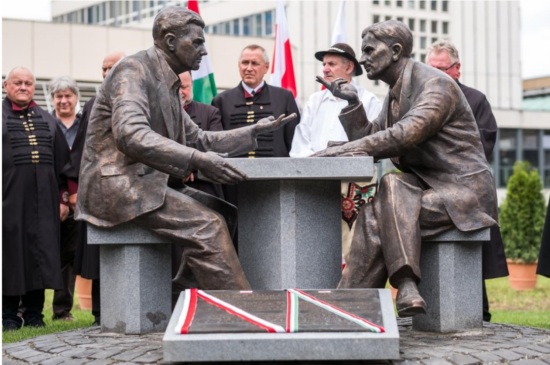
Henryk Ślawiak és id. Antall József szobra