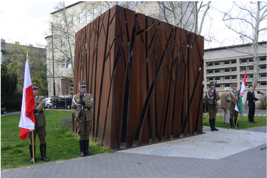
Katinyi emlékpark