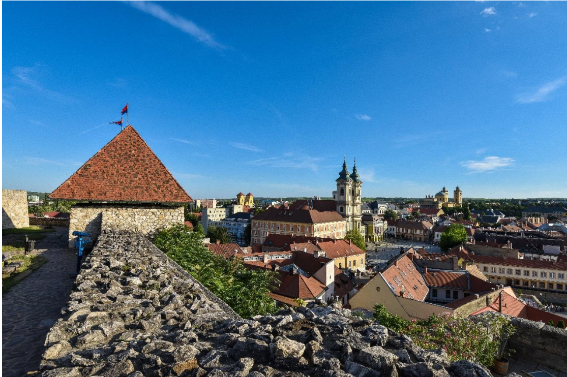
Eger, vár