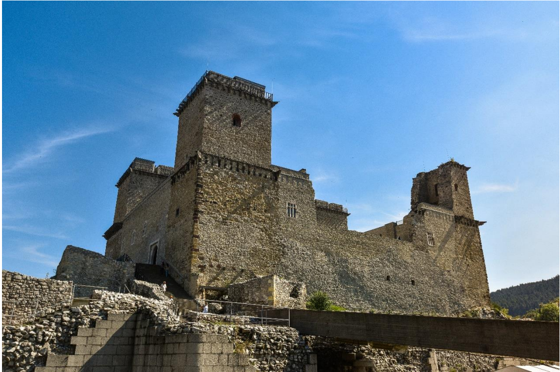
Diósgyőr, vár