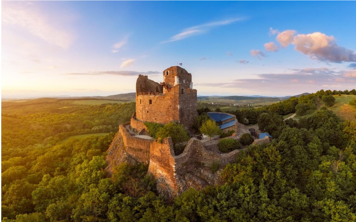
Hollókői vár