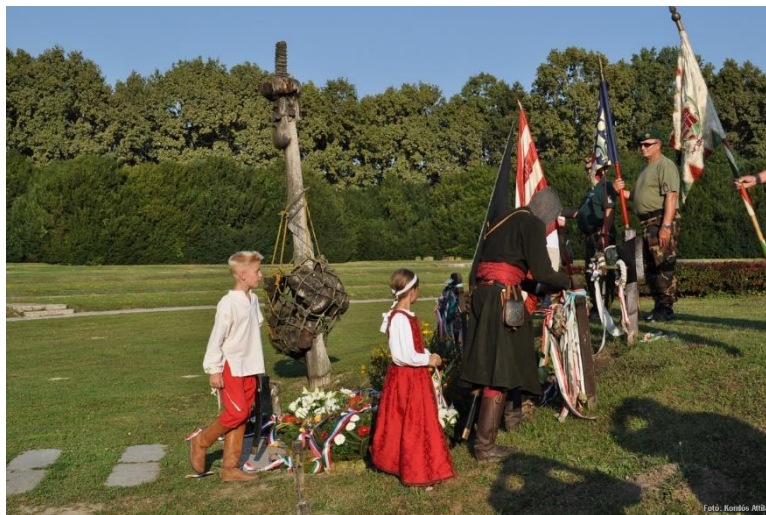
Mohácsi Nemzeti Emlékhely

50 évvel később, a Wawel dombján álló Királyi palotában új királyt koronáznak. Báthory István erdélyi fejedelem, miután elfogadja a lengyel rendek feltételeit és feleségül veszi az örökös nélkül meghalt II. Zsigmond Ágost húgát, Jagelló Annát, Lengyelország királya lesz. Az idei évet Lengyelország, Magyarország és Erdély is Báthory István emlékének szenteli, akinek hön vágyott célja e három állam szövetségének létrehozása volt, amelynek elérésében korai halála megakadályozta. Báthory-t a lengyelek az egyik legnagyobb királyukként tartják számon, halála után őt is a Wawel Székesegyházban temették el.