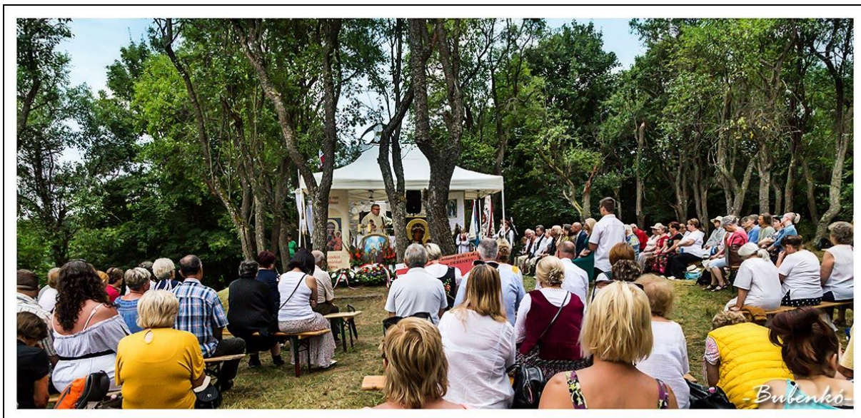
Derenki búcsú - Fot. Bubenkó Gábor