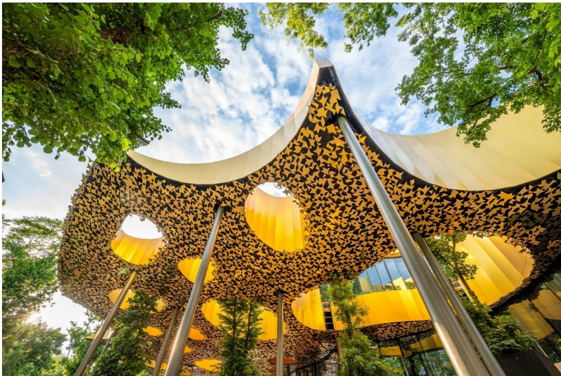
Budapest, Magyar Zene Háza - Fot. Magyar Zene Háza

A Magyar Zene Háza Kodály Zoltán híres mottóját – „Legyen a zene mindenkié!” – szem előtt tartva a rendkívül gazdag magyar zenei hagyományt szeretné közelebb vinni a hazai és külföldi látogatókhoz, interaktív kiállításokkal, zenepedagógiai műhelyekkel, zenei eseményekkel. A japán Sou Fujimoto által tervezett épület egyedi, hullámzást imitáló tetőzetével, illetve az Európában eddigi legnagyobb felületű, egybefüggő homlokzati üvegtáblákból álló falával minden bizonnyal különleges színfoltja lesz a Városligetnek. Csakúgy, mint a szerényebb, de annál díszesebb Millennium Háza, amely a Városliget egyik legrégebbi és legimpozánsabb csarnoka. A 130 éves épület az idők folyamán erősen megrogyott, a szakszerű rekonstrukciónak köszönhetően azonban visszanyerte egykori fényét. Homlokzatán újra csillognak a gyönyörű Zsolnay diszítések, elkészült a századfordulós hangulatú, szintén a pécsi gyárból származó kerámiákkal díszített kávéház is, valamint egy 1500 tőből álló rózsakert, természetesen egy új, Zsolnay-szökőkúttal a közepén.