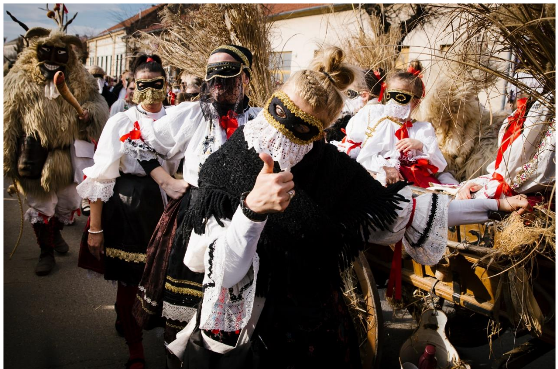
Mohács Busójárás