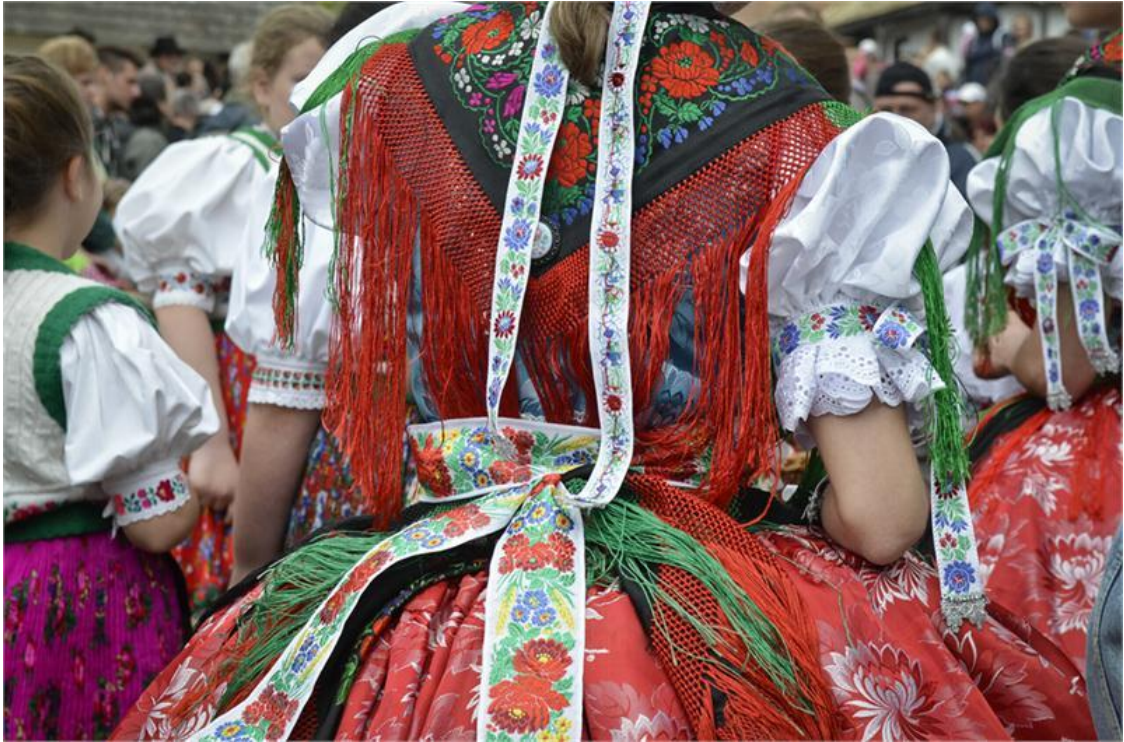
Matyó népviselet