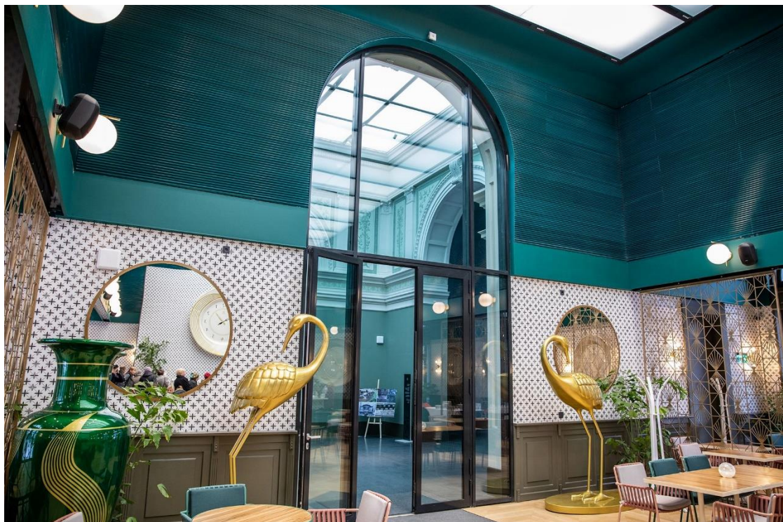
Budapest, Millennium Háza, étterem