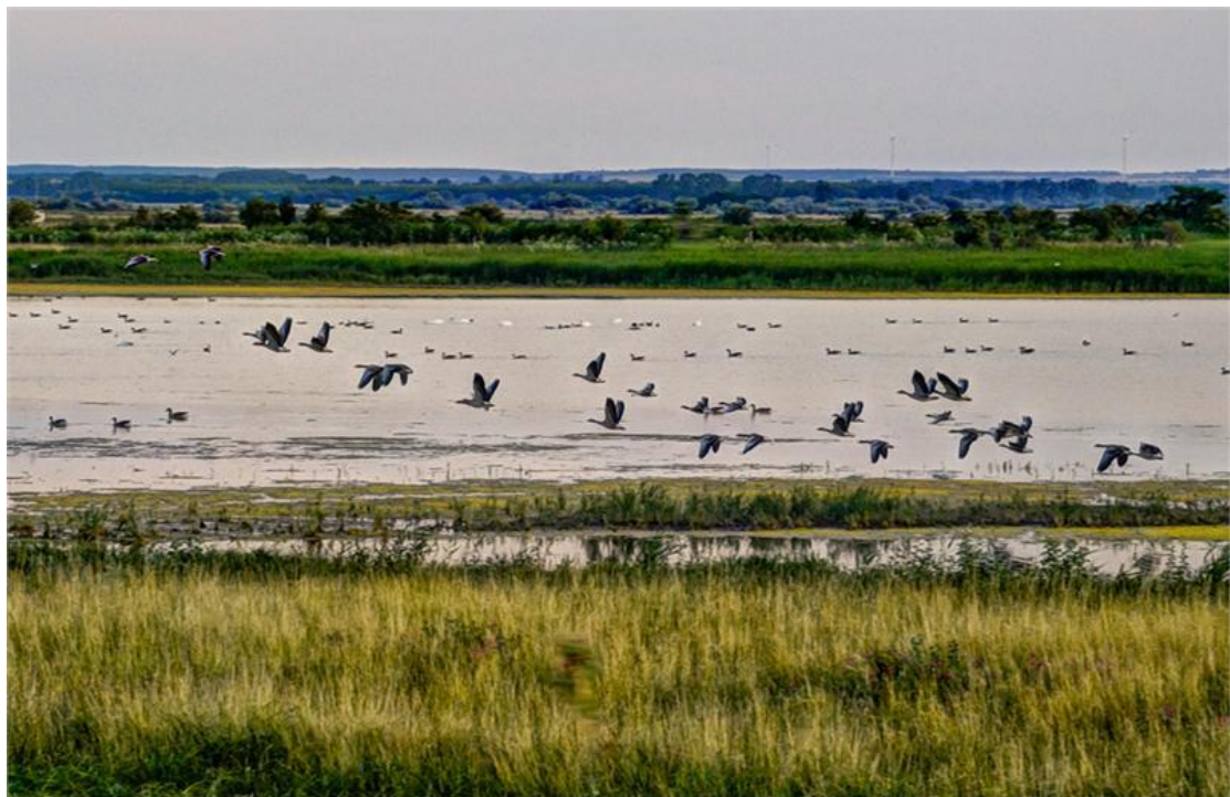
Fertő taj