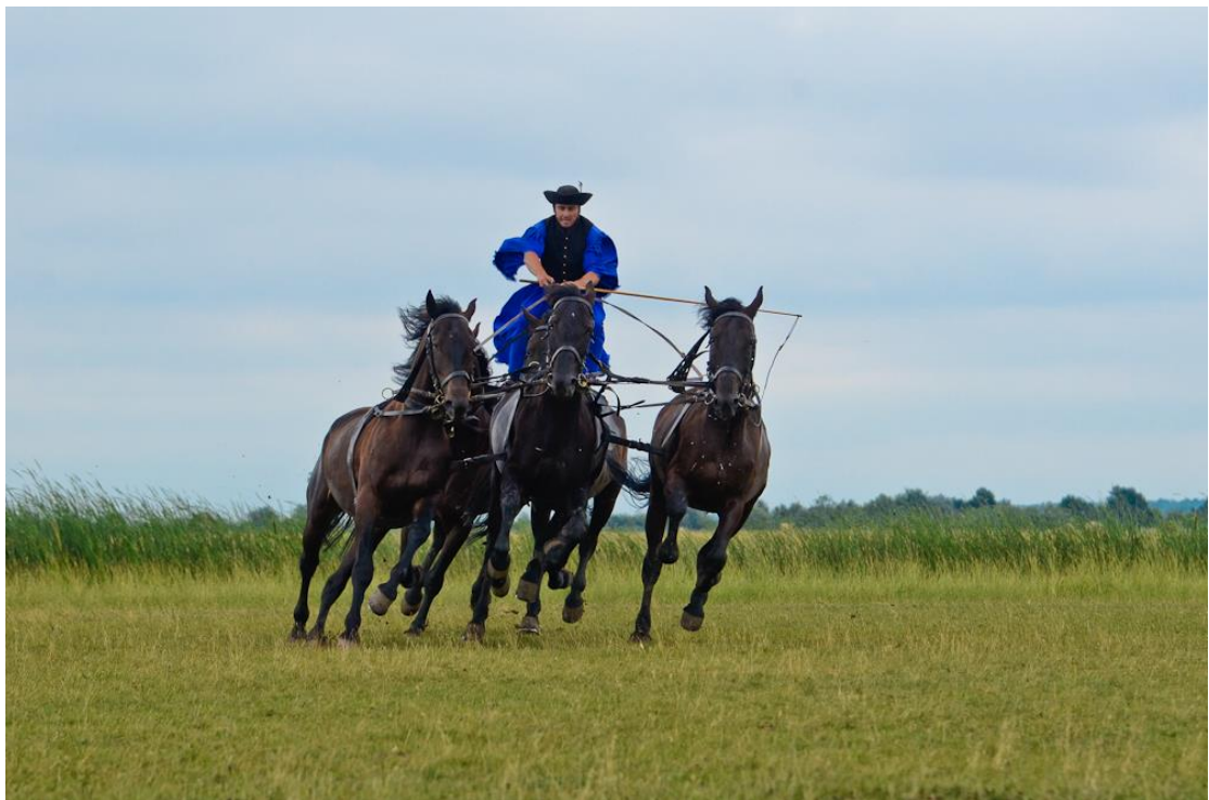
Hortobágy puszta ötös