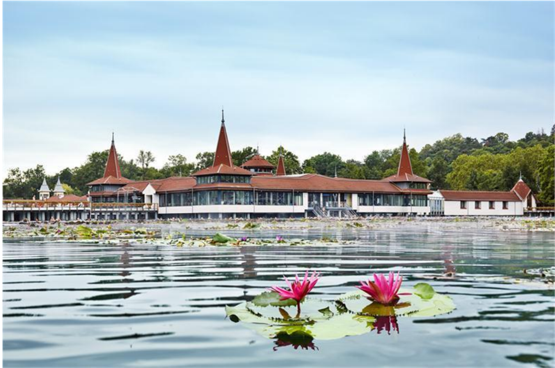
Héviz - Fot. Magyar Turisztikai Ügynökség