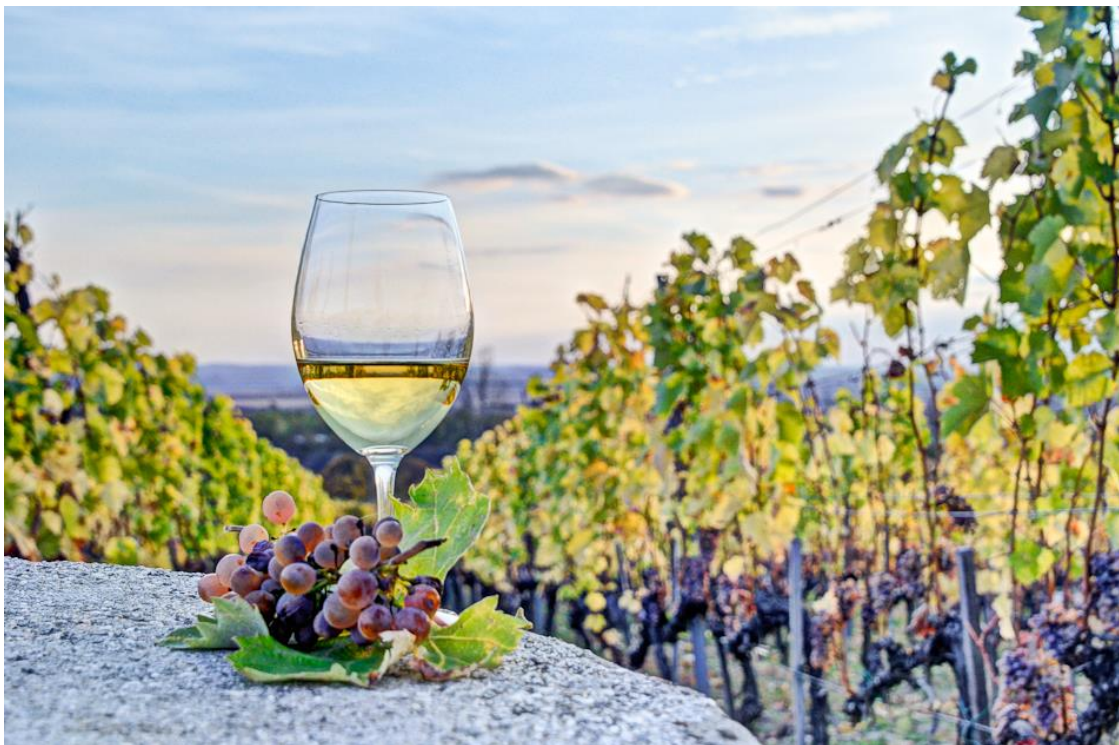
Gasztronómia, Tokaj - Fot. Magyar Turisztikai Ügynökség