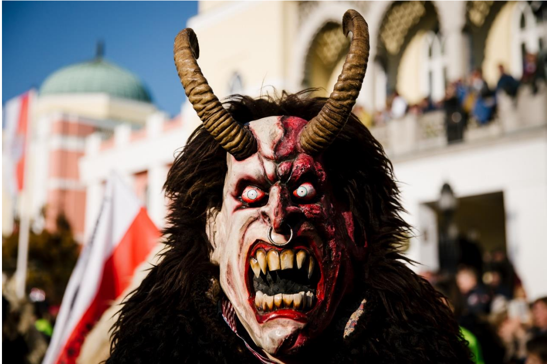
Mohács Busójárás arc