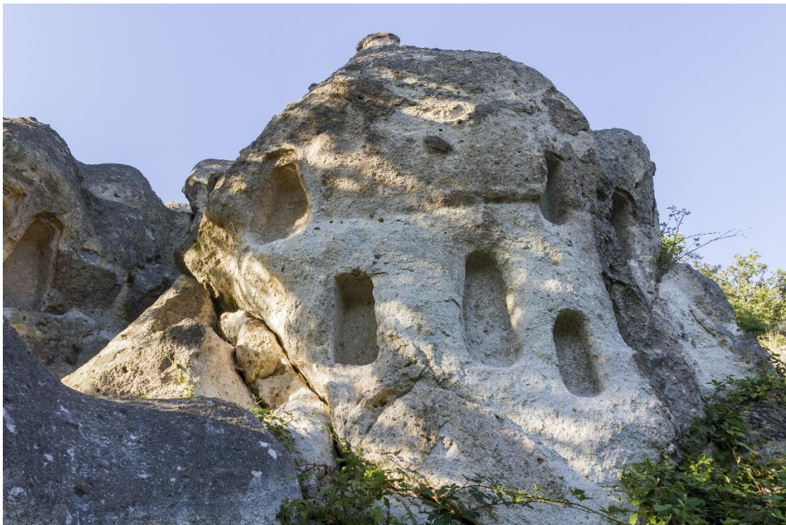
Bükk kaptárkövek - Fot. Magyar Turisztikai Ügynökség