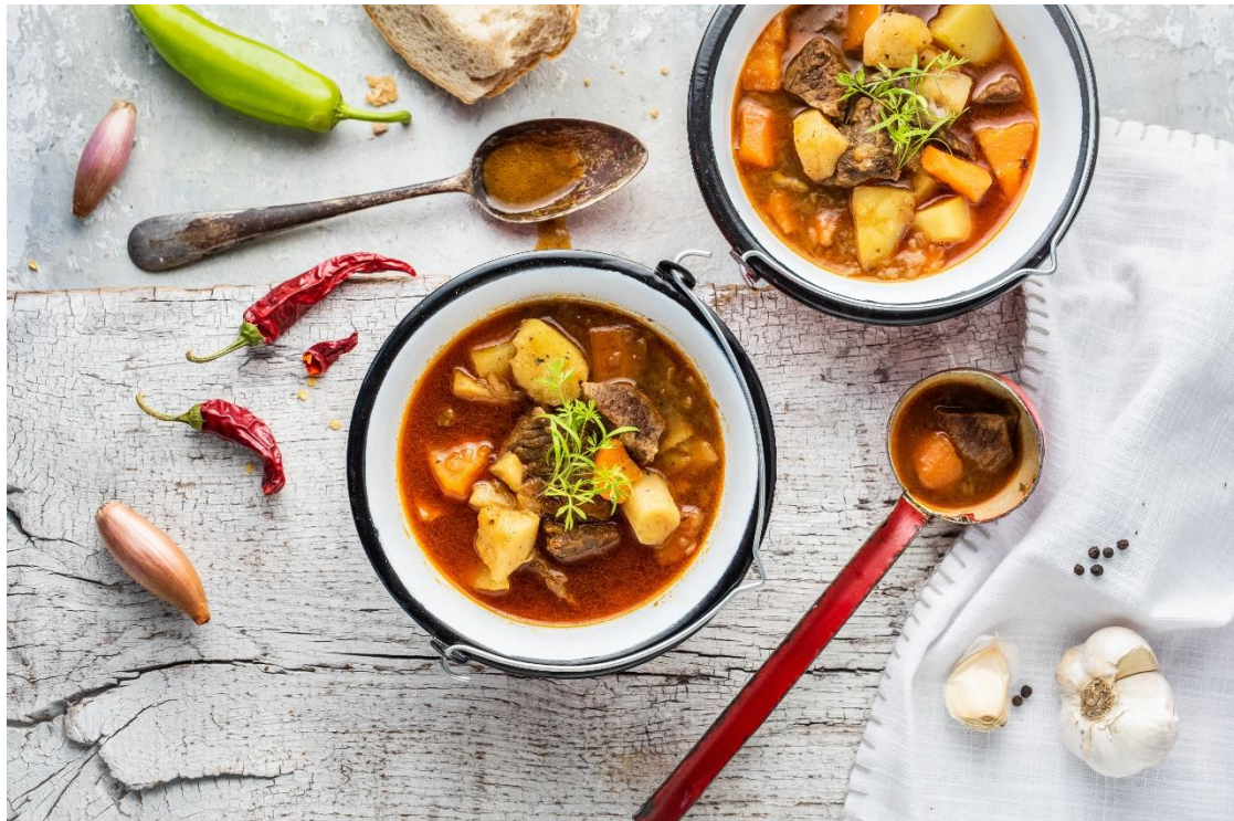
Gasztronómia, gulyásleves