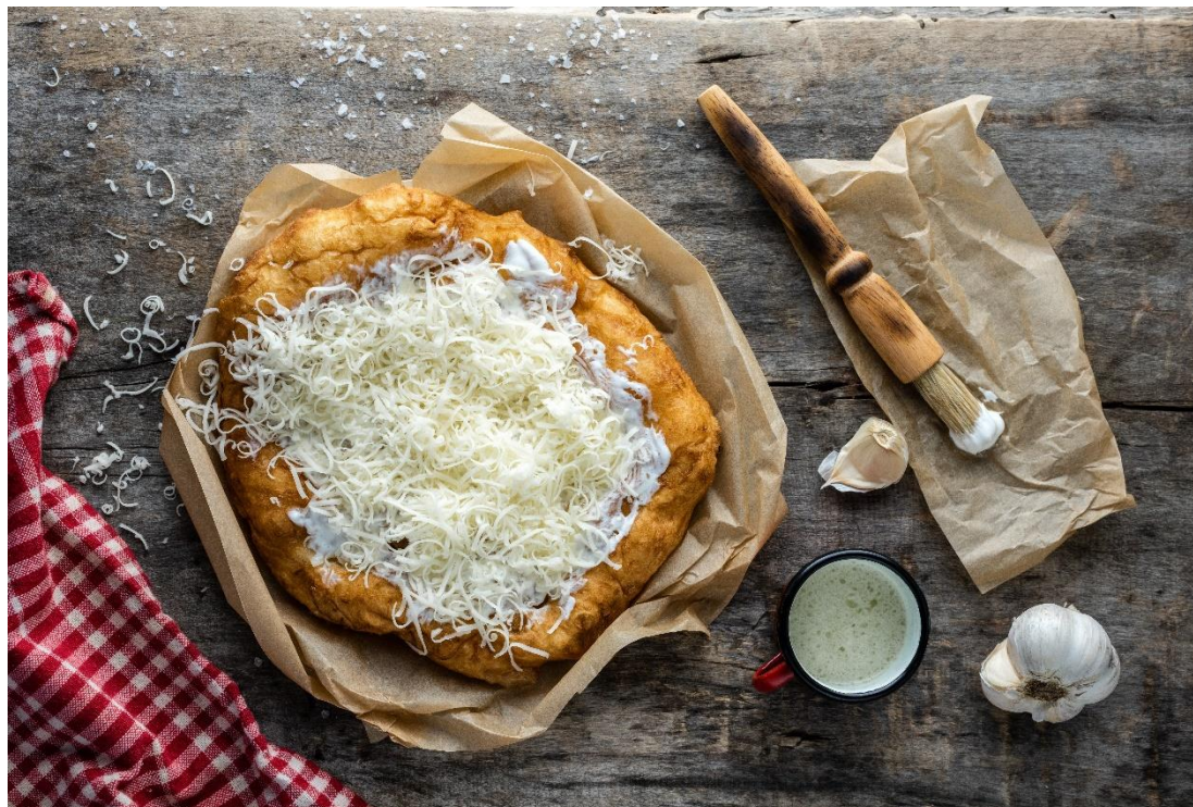
Gasztronómia, lángos

mondás úgy tartja, hogy a szívhez a gyomron át vezet az út. És ha ez valóban így van, akkor hozzánk látogató – főleg lengyel – vendégek fejét jó eséllyel bizony el is csavarjuk!