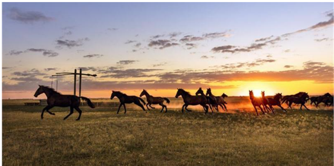
Hortobágy, szürkemarha