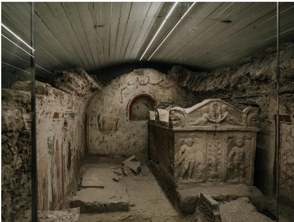
Pécs, Ókeresztény temető