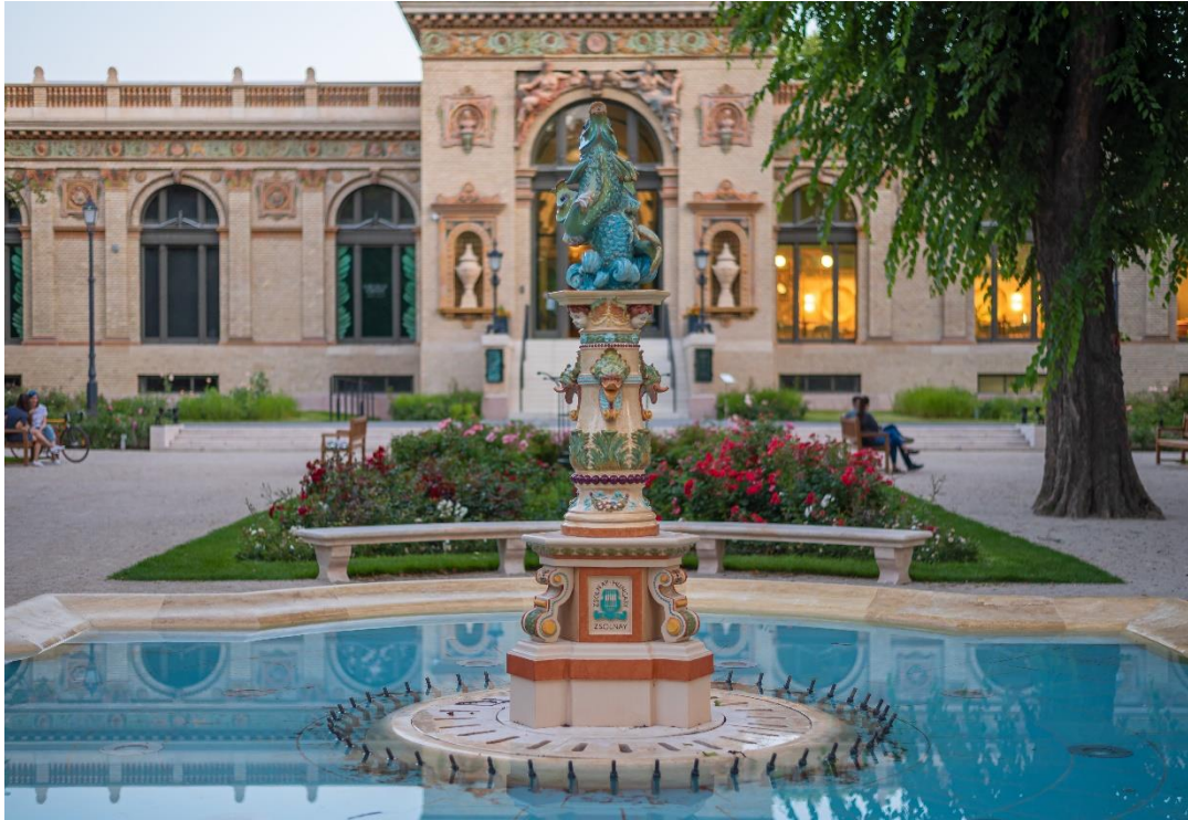
Budapest, Millennium Háza - Fot. Magyar Turisztikai Ügynökség